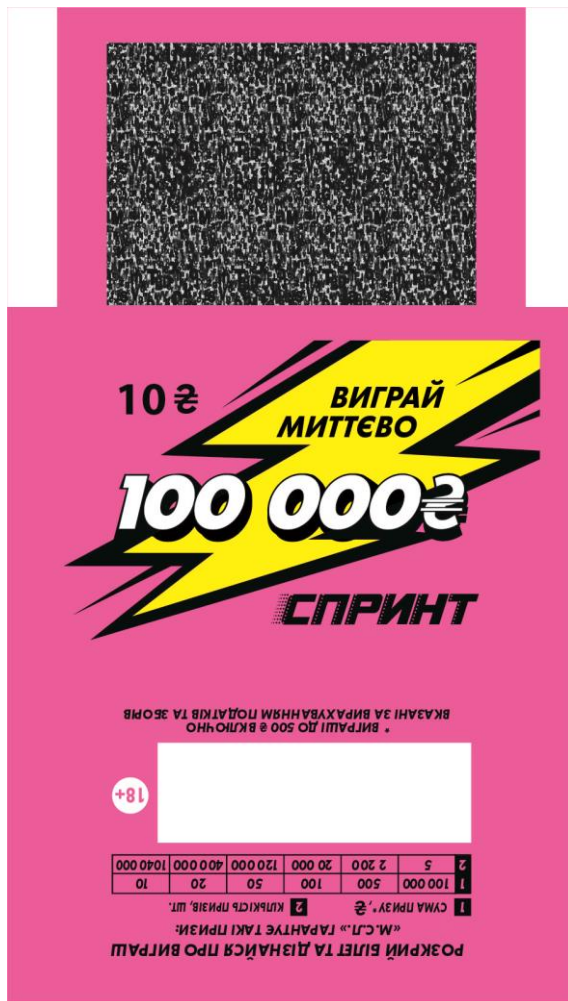
Макет зовнішнього розвороту білета